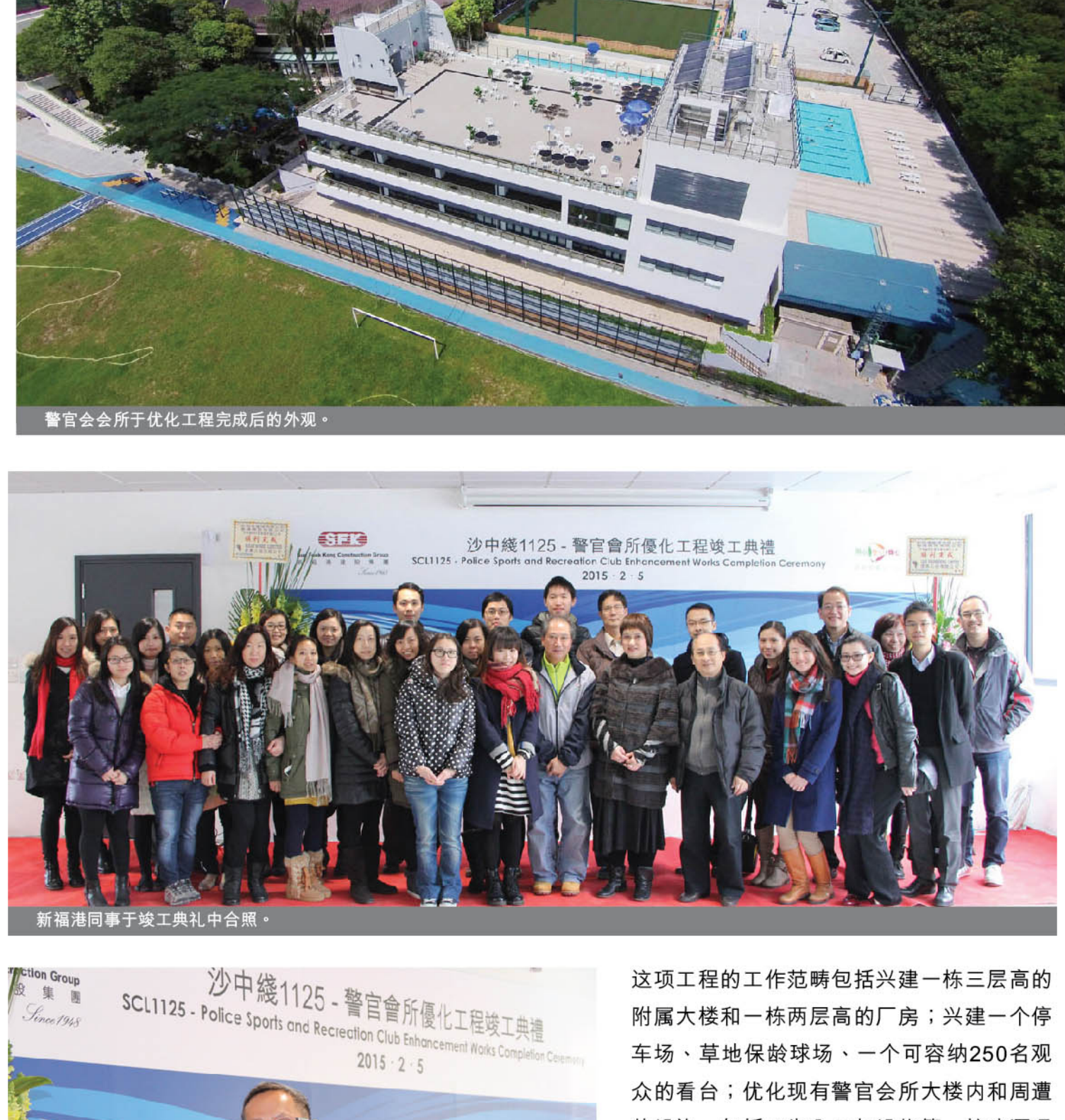
警官会所优化工程完成后的外观。

新福港于本年2月5日为沙中线合约编号1125 - 警官会所优化工程举行了竣工典礼。这项工程于2013年12月展开，造价约两亿九千万。