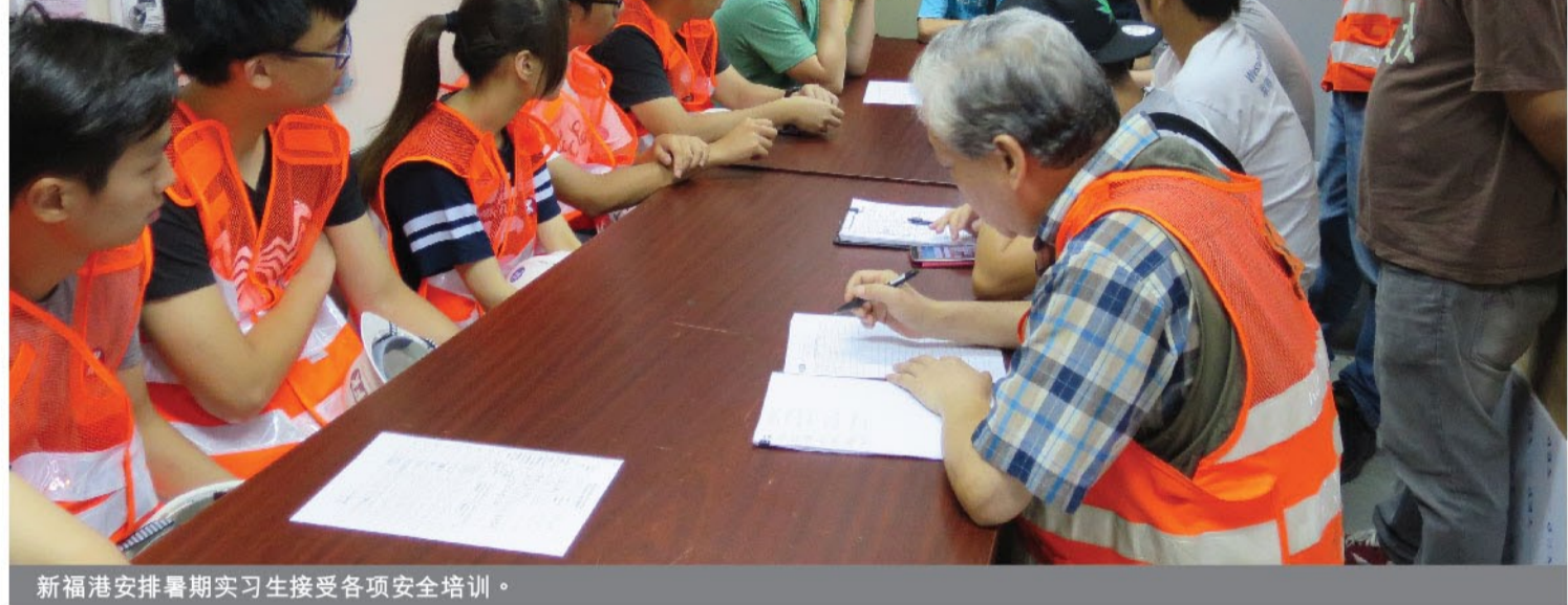
新福港安排暑期实习生接受各项安全培训。

为履行社会责任，给予年轻人获取更多工作经验及增加他们对建造行业的认知，新福港每年暑期均会举办「新福港暑期实习生计划」。今年的暑期实习生分别来自香港和英国等地的大专院校，在导师的悉心指导下，最终顺利完成为期8星期的实习计划。