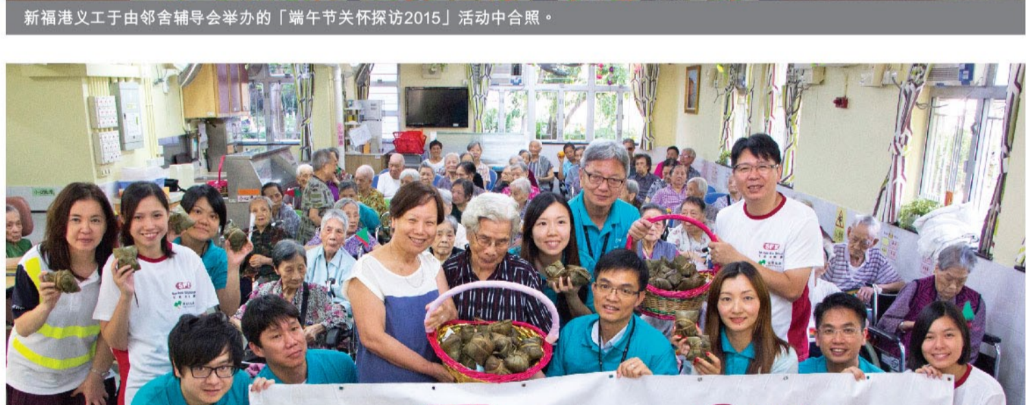
新福港和港铁公司的义工团队与仁济医院李陈玉婭安老院的长者于探访活动中一同合照。

由邻舍辅导会举办的「端午节关怀探访2015」以深水埗区内的独居长者为主要对象。深水埗区内现有超过五千名独居及双老同住的长者，他们大都只得薄弱的支援网络。新福港是次共派出约40名义工参与这项活动，上门探访及致送应节礼物，亲身向长者表达关怀，协助中心了解长者近期的需要，亦藉此增加体弱长者与外界接触的机会。