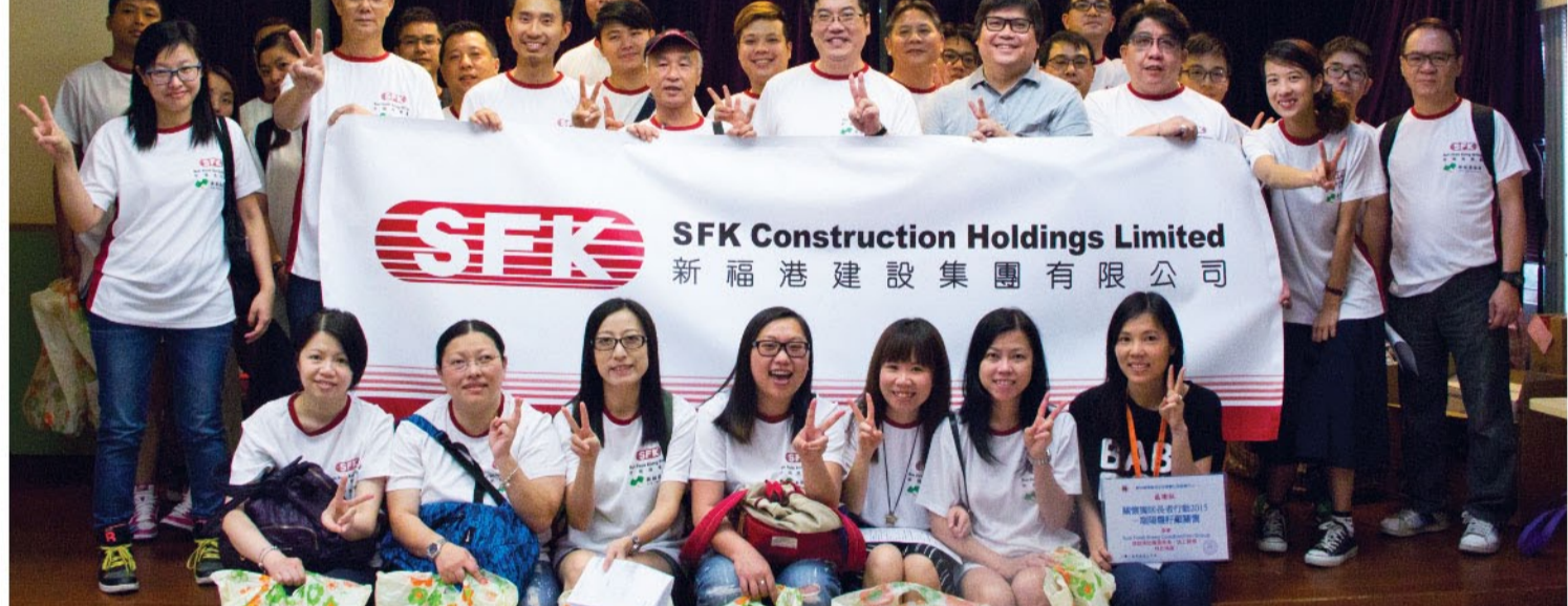
新福港义工于由邻舍辅导会举办的「端午节关怀探访2015」活动中合照。

适逢端午佳节，新福港于本年六月先后参加了由邻舍辅导会举办的「端午节关怀探访活动2015」及与合作伙伴香港铁路有限公司合办安老院探访活动，目的是让独居和居住于安老院中的长者能感受到社会各界对他们的关怀和重视，为他们送上温暖和祝福。