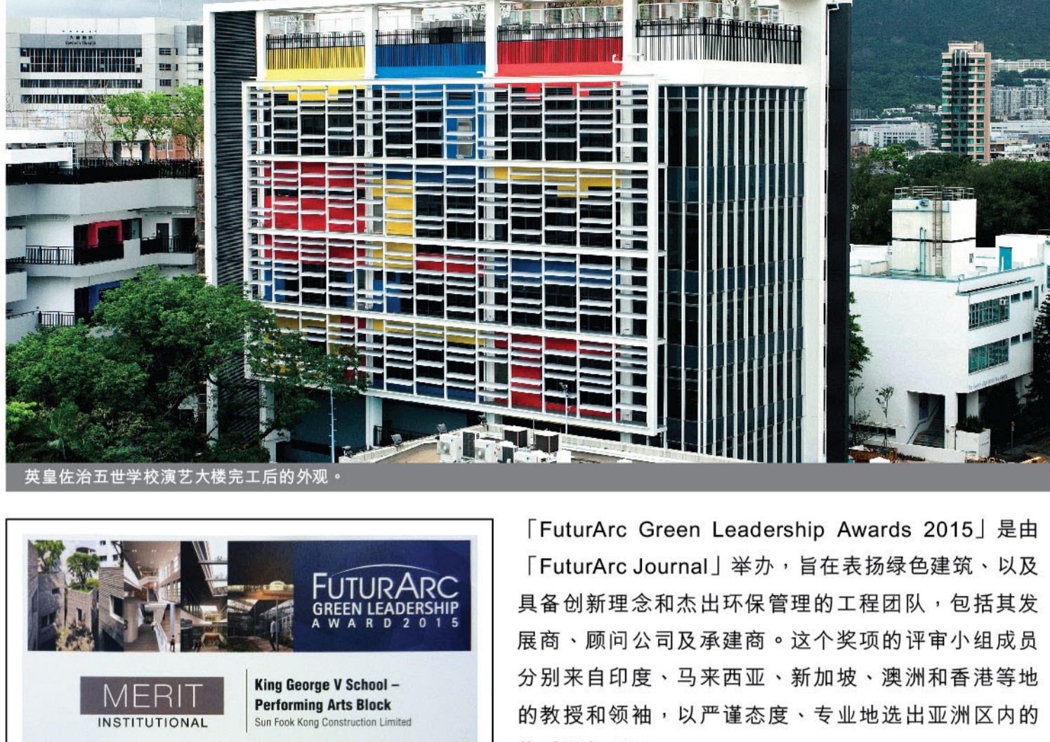
英皇佐治五世学校演艺大楼完工后的外观。

由新福港负责承建的英皇佐治五世学校演艺大楼项目于本年度的「FuturArc Green Leadership Awards」中获颁机构组别的优异奖。这项亚洲建筑行业权威奖项不仅肯定了新福港的环保表现，亦反映出公司的工程质素备受外界认同。