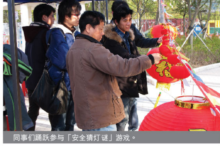
同事们踊跃参与「安全猜灯谜」游戏。

有趣的游戏与丰富的盆菜让来宾们都渡过了一个愉快的晚上。新福港于未来会继续举办不同的团体及联谊活动，以增加员工和合作伙伴间的沟通和联系，建立一个和谐融洽的工作环境。