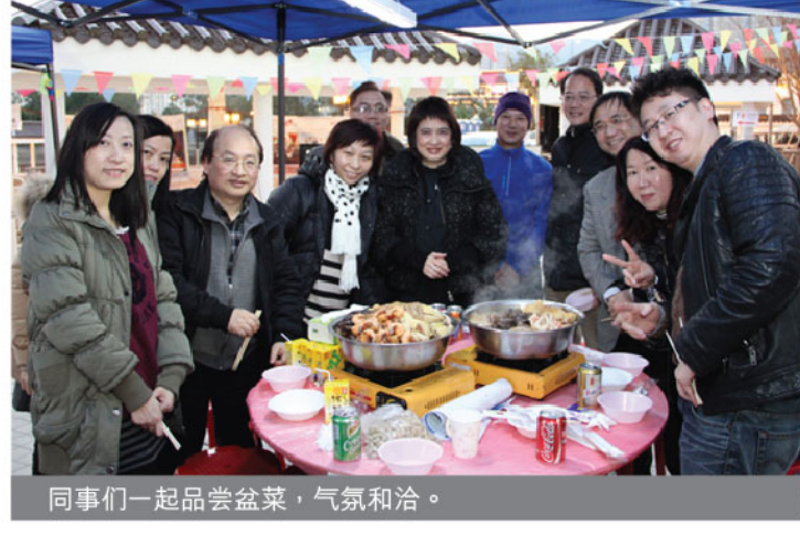
同事们一起品尝盆菜，气氛融洽。