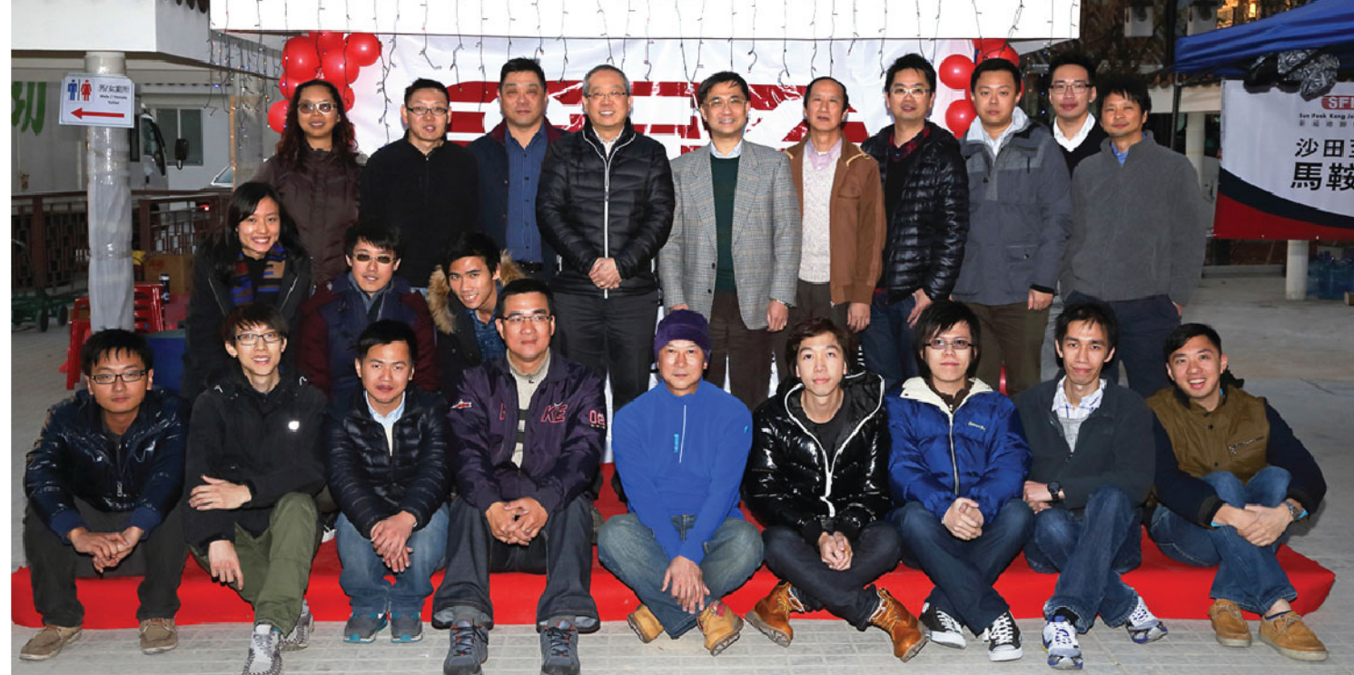
「沙田至中环线合约编号1101 - 马鞍山线改善工程」的工程团队在活动中合照。

新福港旗下的「沙田至中环线合约编号1101 - 马鞍山线改善工程」合约于2014年2月20日在沙田石门公园举办了新春盆菜晚宴。是次活动共有超过200名高级管理层、员工和合作夥伴参与，众人一同共度佳节，场面非常热闹。