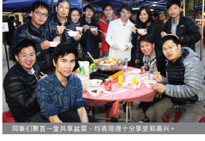
同事们聚首一堂共享盆菜，均表现得十分享受和高兴。