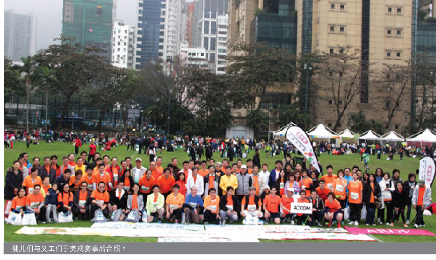
健儿们与义工们于完成赛后合照。

新福港一直热心公益，肩付社会责任。未来，集团会继续关注员工的身心健康和发展需要，同时为有需要人士施以援手，以「关怀员工」、「关爱社群」等核心价值。