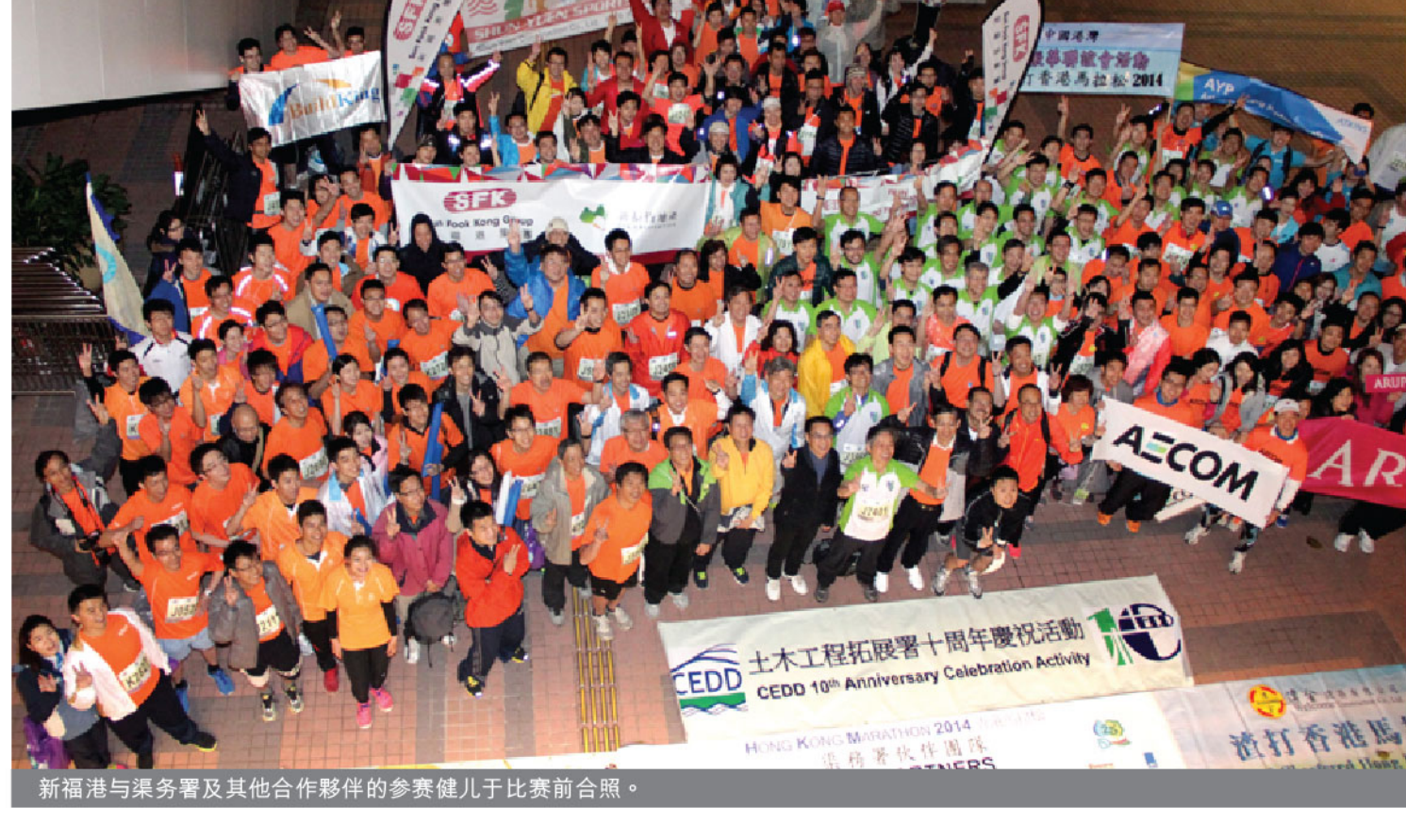
新福港与渠务署及其他合作伙伴的参赛健儿于比赛前合照。

渣打香港马拉松2014赛事于2月16日举办，新福港本年度继续与渠务署及其他合作伙伴一同积极参与这项年度盛事，协助主办机构筹款之余亦可推动员工多做运动。除了10多名参与十公里赛事的健儿，还有20多名义工到场为健儿们打气及提供支援，充分体现了集团内的团队精神。