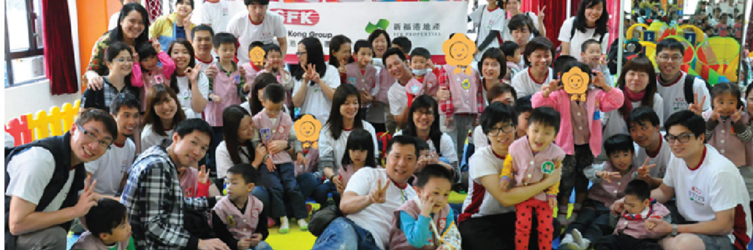
新福港义工与幼儿中心的孩子打成一片，气氛融洽。

新福港于2014年4月12日与香港耀能协会隆亨幼儿中心合办「2014假日营一营」义工活动，服务对象为2-6岁患自闭症或肢体伤残的幼儿。集团及幼儿中心希望籍着这次活动鼓励这群小孩多与他人沟通，让他们更易融入社会。