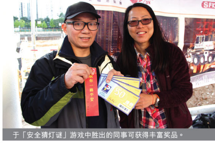
于「安全猜灯谜」游戏中胜出的同事可获得丰富奖品。